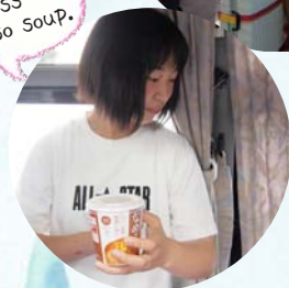
←耐え切れず、 高速PAで米 (おにぎり)や みそ汁を購入 する人続出