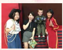
← スポンサー 隊員と♪