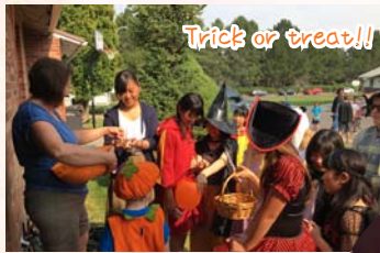
Trick or treat!!