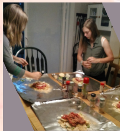
↑ホストファミリーとスペシャル な夕飯を作ったよ