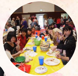
ケーキやパイが いっぱい♪ おいしかったな〜