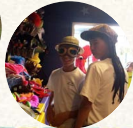
↓紅の豚の人と、レゲエの人(笑)