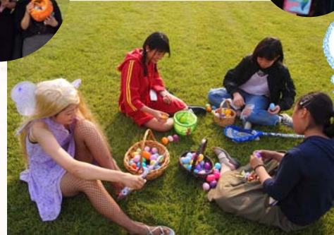
何か入って いるかな?