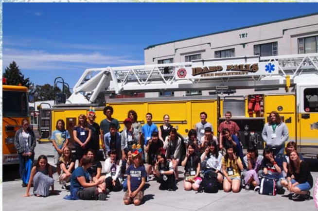
←消防車にも 乗せてもらったよ