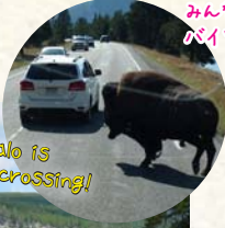
Buffalo is crossing!