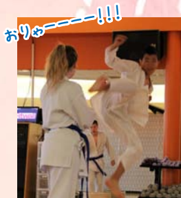
→空手を披露! かつこいそ!