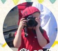
癒しのスパンサーレ私も撮って〜