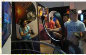
アメリカの 博物館、 楽しくない?