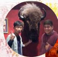
↓アメリカの古い街並みが 再現されたコーナーも