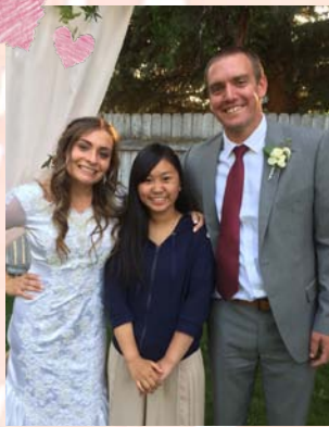
↑アメリカの結婚式を見たよ!