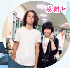
アイダホフォールズ市での最後の集合写真(泣)