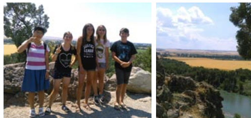
↑みんなでハイキングに行ったよ! 果てしない景色!