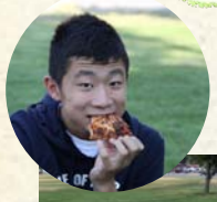
アメリカのピザ最高〜♪