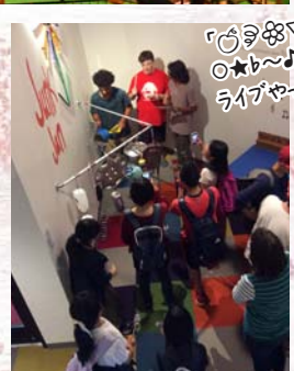
「♡♡♡♡◇◇ 〇★〜♪」 ライブやってますよ〜♪