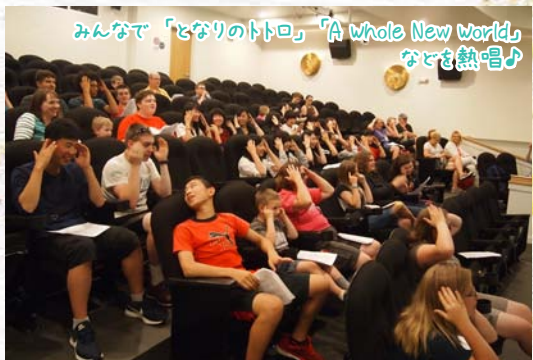
みんなで「となりのトトロ」「A whole New World」 などを熱唱♪