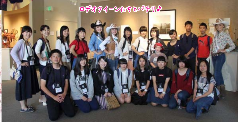
ロデオクイーンたちとパチリ♪