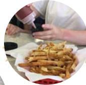
↑ポテトだってこの量☆