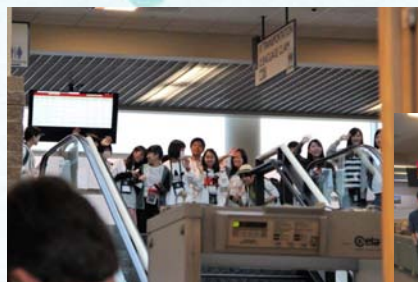
↑「帰りたくないよー」の一行 たくさんの方が見送ってくれました