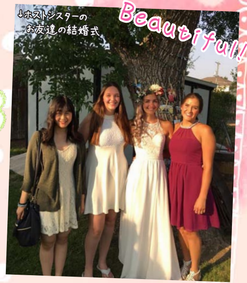
Beautiful!! ↓ホストシスターの お友達達の結婚式