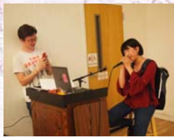
↑ベストシンガー ハナちゃん!