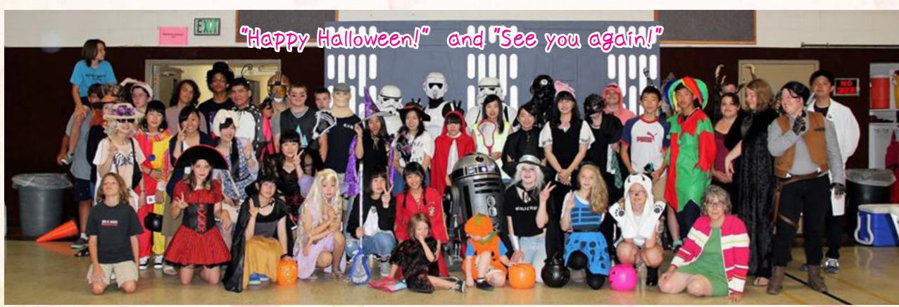
"Happy Halloween!" and "See you again!"