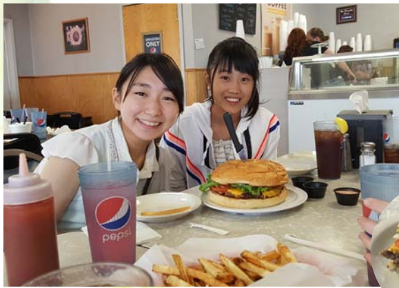
↑「お肉がジューシーで野菜もいっぱい。今まで食べた中で一番おいしかった」と、モエレポーター絶賛の一品