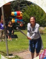
←ピニャータに挑戦! 「お菓子はいっぱいだし!! とりゃー!!!」