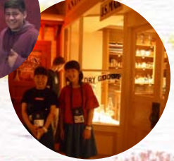
↓期間中 一番の笑顔☆