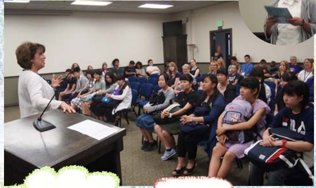
→市長表敬訪問で緊張のスピーチ! でも、かっこよかったぜ!